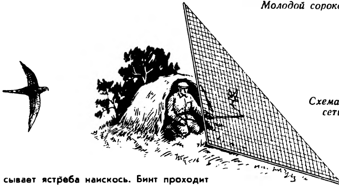
Схема расположения сети и шалаша.

сывает ястреба наискось. Бинт проходит под одним крылом и через другое плечо. Снизу от этой привязи идет веревочка, две другие привязаны к ногам ястреба. Охотник сажает птицу на руку, на которую надет рукавица, и все три веревочки зажимает в кулаке. В таком положении ястреб, помимо желания хозяина, лишен возможности даже взлететь и никогда не вытянет себе ноги. В хвост, к стержням средних рулевых перьев, на проволочке крепят бубенчик, который позволяет охотнику по звуку найти в высокой траве ястреба с пойманным им перепелом.