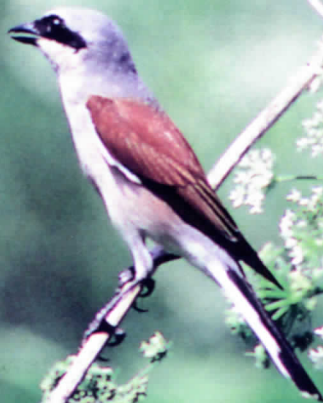
Взрослый самец сорокопута-жулана

На охоту выходят рано утром в сопровождении собаки. Когда она выгоняет перепела, охотник пускает ястреба, тот догоняет птицу, хватает на лету и садится с ней в траву.