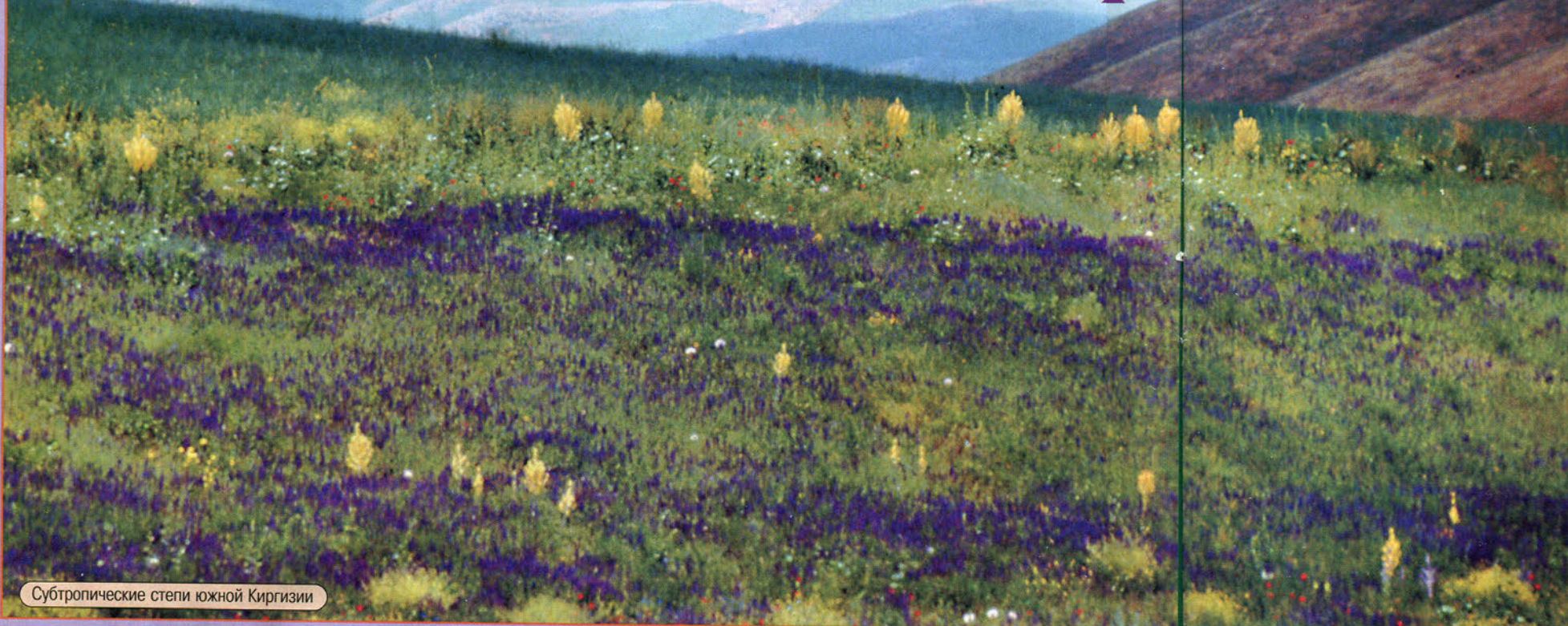
Субтропические степи южной Киргизии