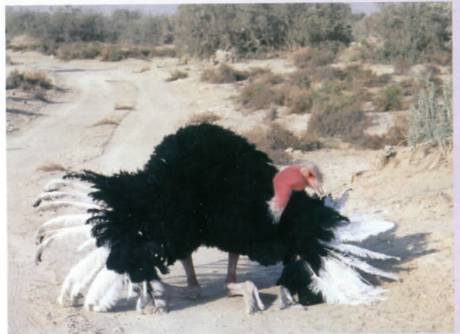
«Приветствие» непрошеным гостям

На место наблюдений привезли прицеп к трактору с высокими деревянными бортами, которые должны были уберечь нас от удара страусиной ноги. Собрав аппаратуру и воору-