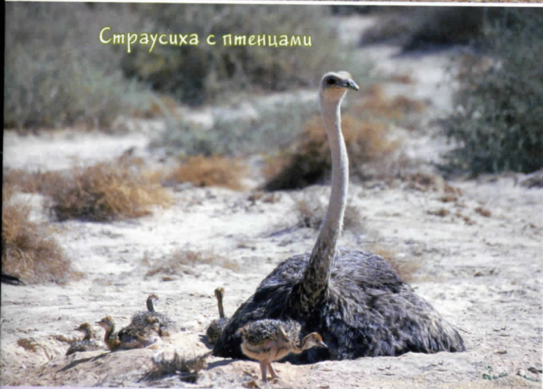
Страусиха с птенцами

правские охранники, курсируют африканские страусы. Каменки нигде нет. В чем же дело? Здесь засуха: уже несколько лет вовсе не было дождей, в ущельях стоят безжизненные деревья, сухие кусты. Почти нет насекомых — птицам нечего есть. В засушливые годы каменки не размножаются, а их индивидуальные участки увеличиваются.