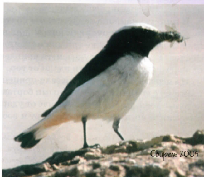
Каменка траурная >

Мы судорожно приводили в «боевую готовность» фотоаппараты, налаживали диктофон (вдруг запоет?!)... И тут около машины показался самец африканского