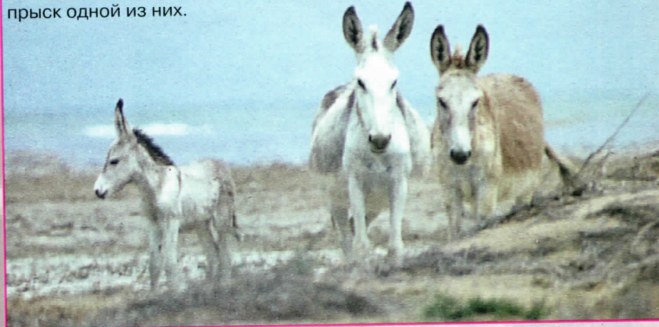
Две самки и юный отпрыск одной из них.

временем, в силу законов генетики, наиболее распространённым в сообществе, лишённом постоянного притока «свежей крови» со стороны.