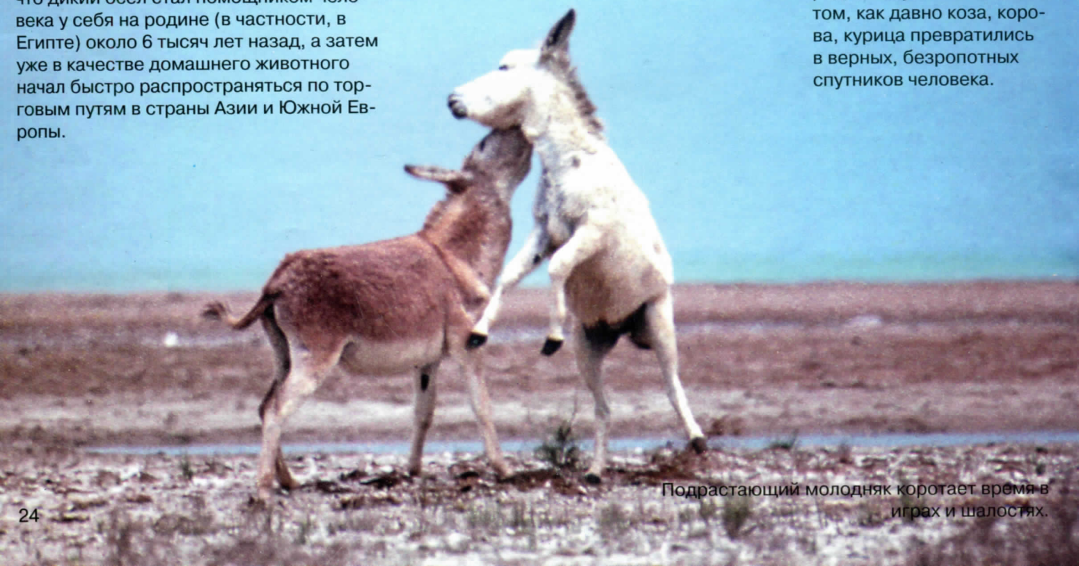
Подрастающий молодняк коротает время в играх и шалостях.

Мы каждый день видим у себя на столе молоко, мясо, яйца и прочую снедь, поставляемую нам домашними животными, но редко задумываемся о том, как давно коза, корова, курица превратились в верных, безропотных спутников человека.