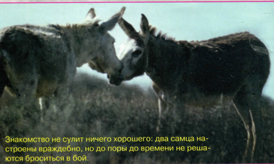
Знакомство не сулит ничего хорошего: два самца настроены враждебно, но до поры до времени не решаются броситься в бой.

Большинство домашних животных стали полностью зависимыми от человека очень давно — в те незапамятные времена, когда бродячие племена охотников и собирателей стали переходить к оседлому образу жизни. В Месопотамии, на территории нынешнего Ирака и соседних с ним стран, поселения оседлых земледельцев существовали уже 7 тысяч лет назад, а то и значительно раньше. Именно тогда у людей появилась острая необходимость в тягловой силе. Эту потребность как нельзя лучше мог удовлетворить осёл — животное весьма