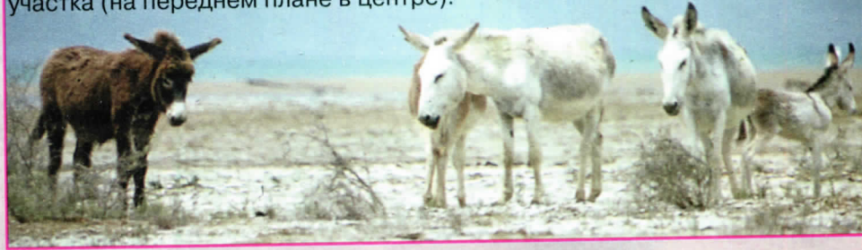
Семейная группа во главе с самцом — хозяином участка (на переднем плане в центре).

чисто белых особей, каких довольно редко приходится видеть в туркменских посёлках на материке. Это хороший пример того, к каким результатам может приводить длительное скрещивание между родственными животными, принадлежащими к сравнительно малочисленной, замкнутой группировке. При этом первоначально редкий вариант окраса может стать со