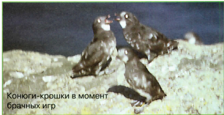
Конюги-крошки в момент брачных игр

рый, ничем не замечательный, и лишь к весне на нём нарастают яркие карминно-красные, оранжевые или жёлтые роговые пластинки. Они сохраняются лишь на протяжении короткого периода гнездования, и вскоре после того как птенцы покидают гнездо, их родители утрачивают свои свадебные украшения.