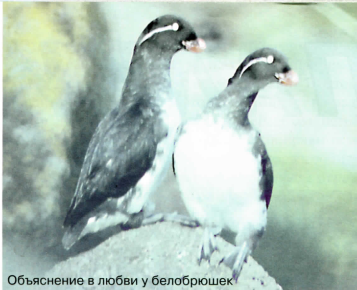
Объяснение в любви у белобрюшек

нижняя половина клюва имеет форму ложки, которой охотник ловко зачерпывает порцию воды с очередной жертвой. Птица сразу же отправляет её про запас в особый горловой “мешок”, так что при каждом возвращении к гнезду родители доставляют единственному птенцу солидную порцию корма.