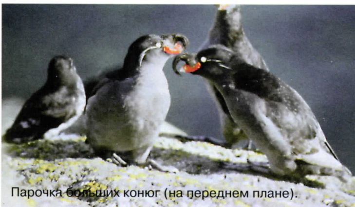
Парочка больших конюг (на переднем плане).

Яркая окраска клюва у больших конюг, белобрюшек и ипаток служит своего рода сигналом, поощряющим биллинг. Вероятно, именно поэтому у этих птиц в отличие от всех прочих клюв приобретает яркую окраску только перед началом сезона размножения. Зимой он тёмно-бу-