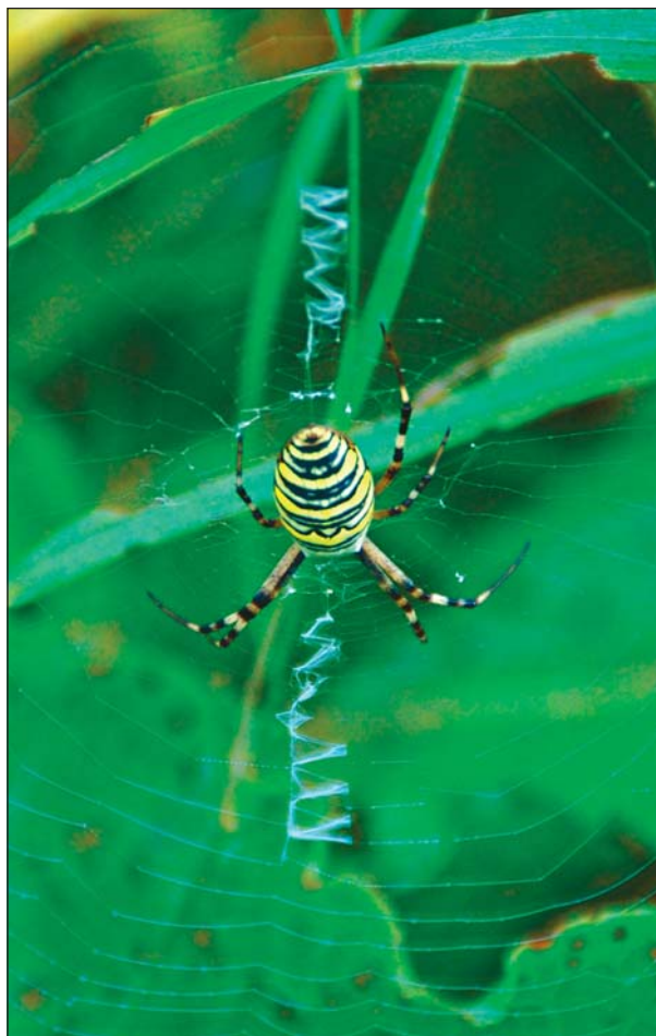
Хорошо видны зигзаговидные стабилименты, расположенные над пауком и под ним.

Полосатая аргиопа, разумеется, хищник. Основная ее добыча, судя по расположению сетей, — обитатели нижнего яруса растительности, обычно плохо летающие. Как правило, это прямокрылые (кобылки и кузнечики), хотя в ловушку могут случайно попадать и насекомые-опылители, например, пчелы. Все это выдает полосатую аргиопу как исконного обитателя зоны степей.