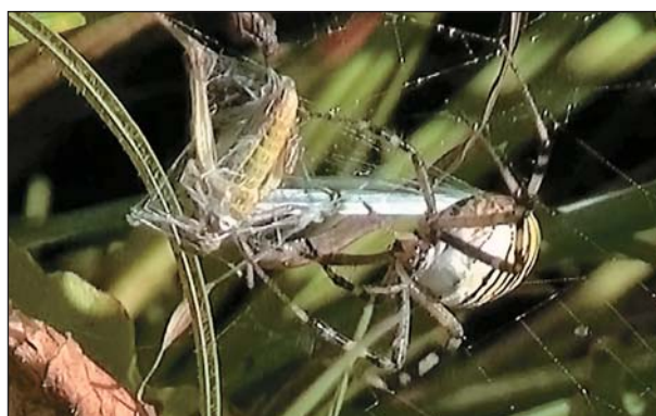
Этапы заматывания укушенной жертвы (молодого кузнечика) в паутину.