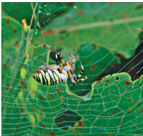
Обратите внимание, что паутина расположена в травяном ярусе, т.е. практически не приподнята над субстратом, как это бывает в традиционных местообитаниях в степной зоне.