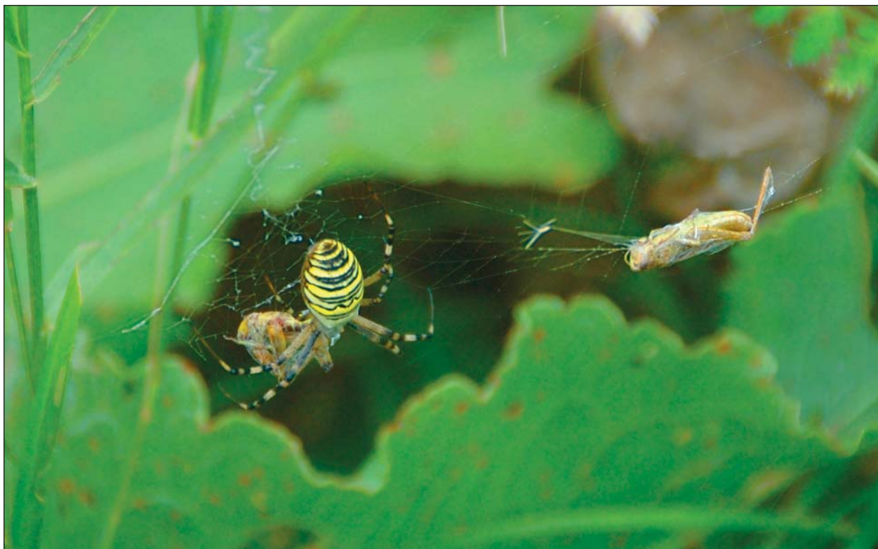
Аргиопа и две ее жертвы, одна из них подвешена «про запас».

раются несколько кавалеров, конфликтов и драк между ними не избежать. Самка может воспринимать самца как добычу и подчас бросается на него, кусая чаще всего в ногу. К счастью, пауки способны к автотомии — отбрасыванию конечностей в случае опасности. (Разрыв хитиновых покровов на одном из небольших члеников в основании ноги — вертлуге — происходит с помощью особой мускулатуры.) После спаривания самцы живут недолго, а самка начинает строить кокон для яиц, размером примерно с вишневую ягоду, размещая его в укромном месте.