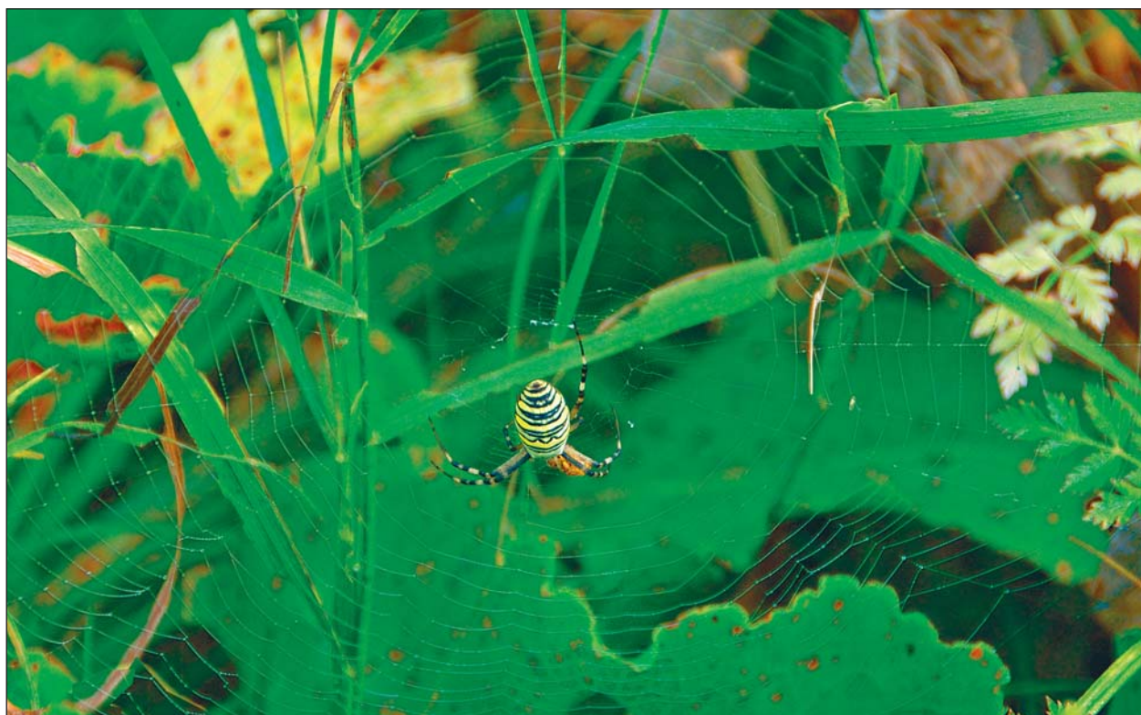
Самка полосатой аргиопы в центре своей паутины. Хорошо видна граница между липкой ловчей спиралью (она ярче) и нелипкой паутиной в центре сети.

Как и большинство кругопрядов, аргиопа плетет сеть, в основе которой лежит рамка-каркас из толстых, прочных, сухих и нелипучих нитей. Такими же свойствами обладают и радиальные нити, идущие из центра сети к каркасу. Внутри него от периферии к центру тянется радиальная спиральная нить (эластичная и клейкая), не доходя-