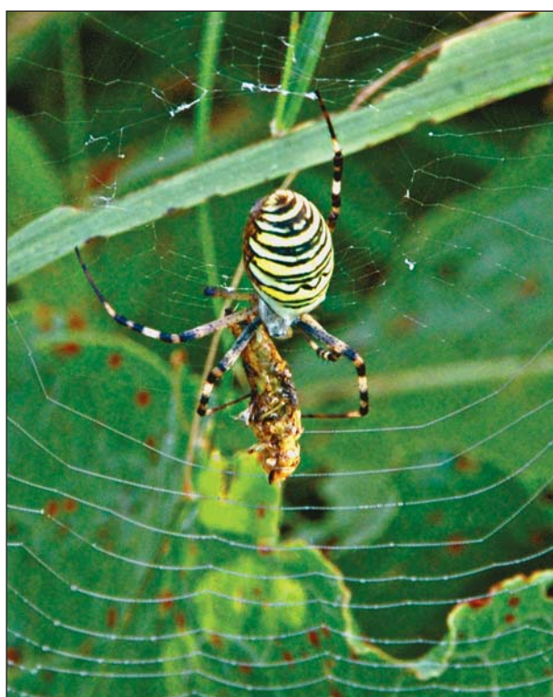
Самка полосатой аргиопы высасывает свою добычу — молодого кузнечика.

Паук убивает добычу ядом, выделяемым через когтевидный членик хелицер при укусе, а затем завертывает ее в паутину. На видеокдрах хорошо видно, как паук регулирует толщину паутинной струи, выбрасываемой из желез в задней части брюшка. В ответственные моменты эта струя выглядит в виде широкой ленты, вызывая в памяти работу продавца в магазине, когда тот заматывает скотчем коробку с увесистым содержимым. После фиксации добычи паук, удерживая коготком задней ноги свободный конец нити-обмотки, тащит свою жертву в середину сети, где и высасывает ее мягкие ткани.